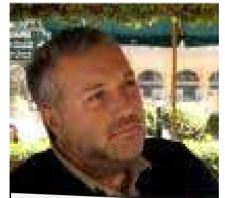
Barbera: el nuevo mecanismo de autenticación simplifica el acceso a la e-infraestructura

evitando así el proceso tradicional de certificación digital. Es fácil y es estándar, según puede desprenderse de los detalles que explican esta propuesta de autenticación, con la que un usuario puede ser autorizado haciendo clic en el proveedor de identidad más cercano a su región o país, respetando las políticas de Grid en términos de seguridad. Con un usuario y una clave, el investigador es autorizado a usar la e-plataforma, obtener diferentes roles y privilegios en el SG, gracias a una interfaz que enlaza las solicitudes con la infraestructura Grid, por medio de una biblioteca de servicios que resulta interoperable entre los diferentes software.