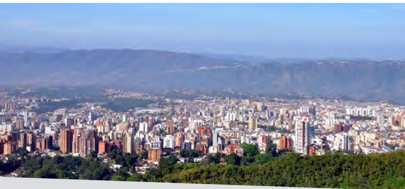
La ciudad de Bucaramanga fue la sede de encuentro para definir el Modelo de Servicios de Computación Avanzada en la región