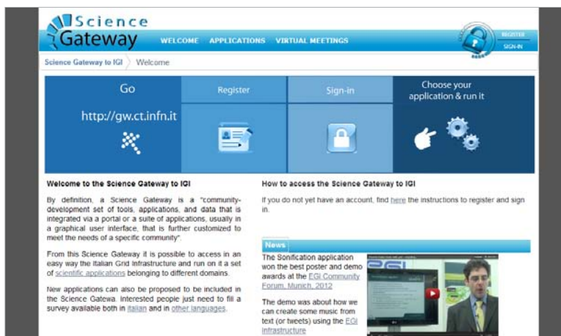
Versión antigua GSG