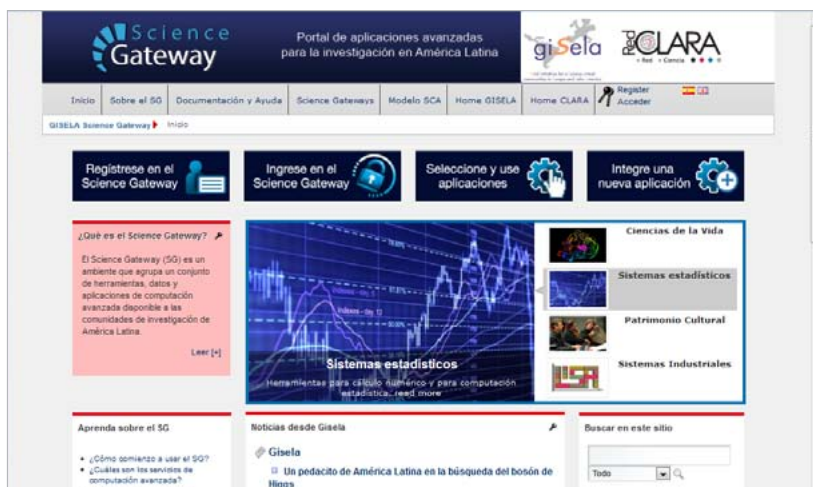
Nueva versión del GSG